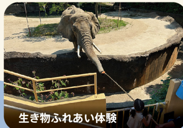
生き物ふれあい体験