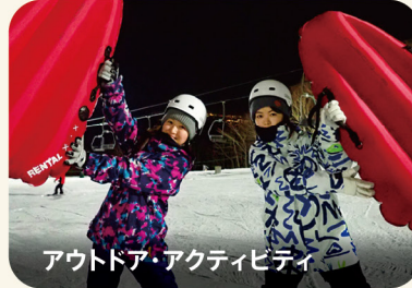
アウトドア・アクティビティ