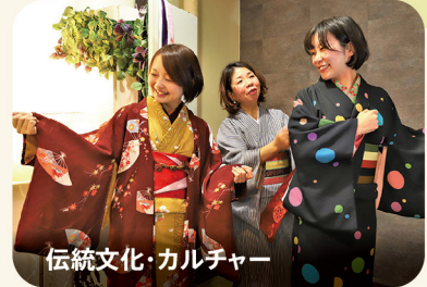
伝統文化・カルチャー