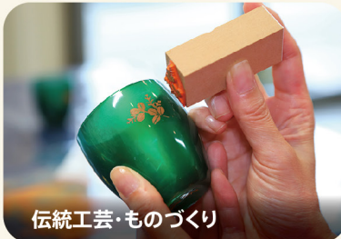
伝統工芸・ものづくり