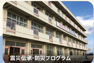
震災伝承・防災プログラム