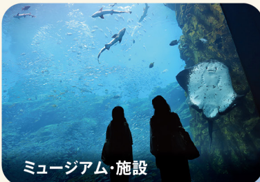
ミュージアム・施設