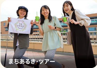
まちあるき・ツアー